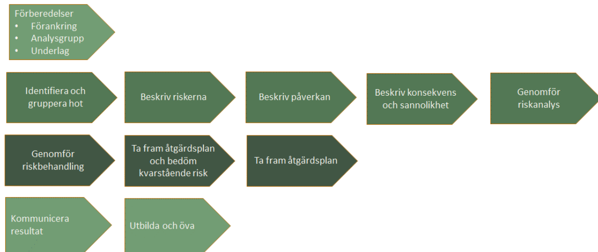
Figur 1 RSA-metoden